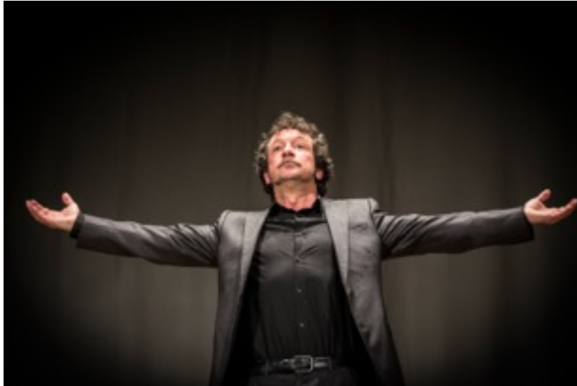
foto di scena - Agrodolce